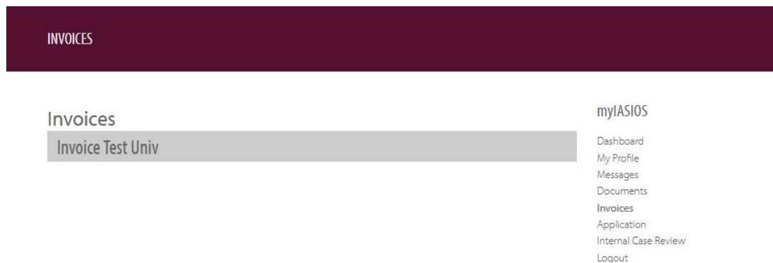
Figura 4: Fatture su myIASIOS

Le strutture avranno accesso alle loro fatture sul portale myIASIOS. Per aprire le fatture, andare su "Fatture" e cliccare sulla barra grigia; in questo modo si potrà accedere alle fatture in formato PDF, pronte da scaricare o stampare. Solo il Rappresentante autorizzato, la Persona di contatto principale o il Rappresentante autorizzato supplente potranno visualizzare le fatture.